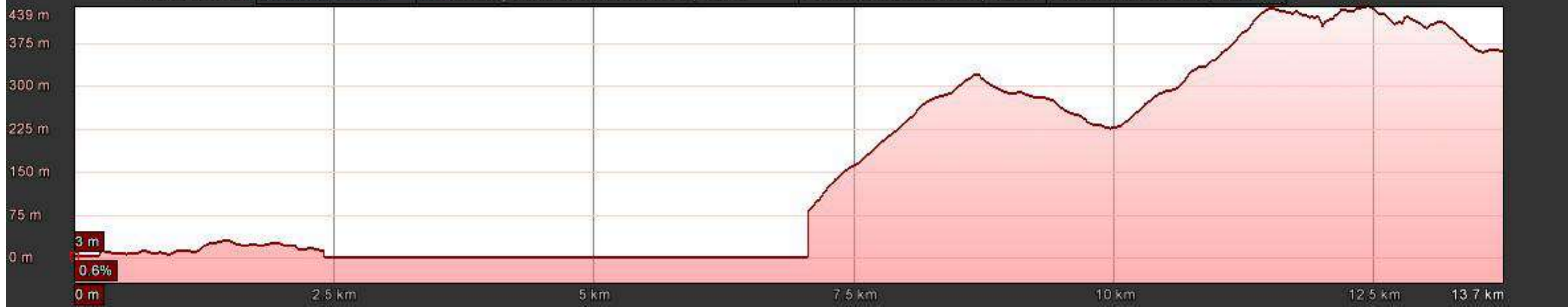
Gráfico: min., media, máx. Elevación: 0, 156, 439 m Total de intervalo: Distancia: 13.7 km Incremento/pérdida de elevación: 684 m, -325 m Pendiente máxima: 73.5%, -32.6% Pendiente media: 5.9%, -7.2%

Fecha de las imágenes: 12/9/2015 28°54'16.80" N 13°44'22.99" O elev. 26 m alt. ojo 7.92 km